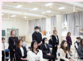
▲ 呼名後起立してお辞儀